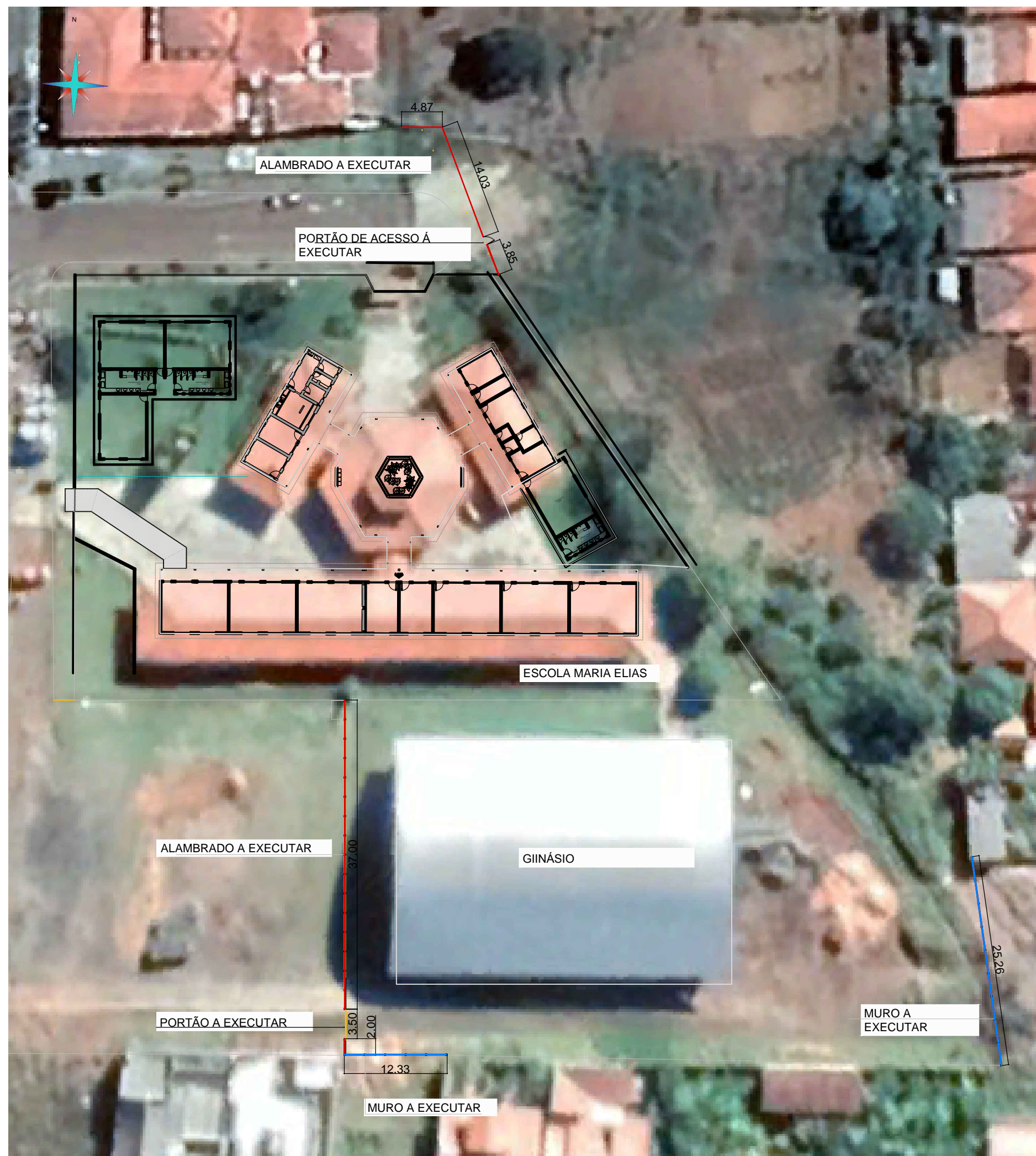
IMPLANTAÇÃO SEM ESCALA

ESTE DESENHO É DE PROPRIEDADE DE E FORNECIDO COM OBJETIVO ESTRITAMENTE CONFIDENCIAL E NÃO DEVE SER DIVULGADO PARA TERCEIROS, REPRODUZIDO OU USADO COM PROPOSITOS DE FABRICAÇÃO SEM EXPRESSA E ESCRITA PERMISSÃO DE